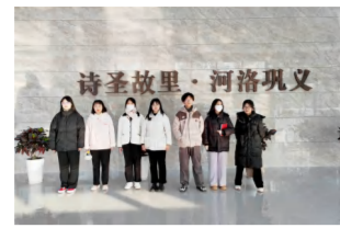
我校组织学生参观游览博物馆

博物馆是保护和传承人类文明的重要场所,是架起过去、连接当下、展望未来的文化桥梁。近年来,各地掀起了“博物馆热”,不仅是旅游黄金周,周末甚至是工作日,一些“网红”博物馆都“一票难求”。