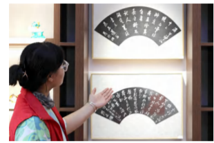
我校学生在博物馆实习工作并参与志愿讲解活动