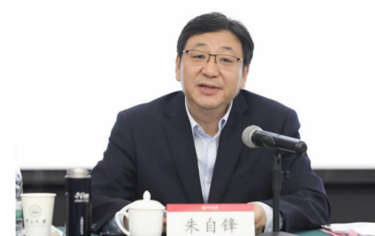
▲省教育厅党组成员、副厅长朱自锋讲话